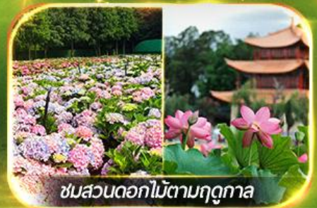
ชมสวนดอกไม้ตามฤดูกาล

นั่งกระเช้ากุเขาสหะเจี้ยวจื่อ ชมน้ำตกสุดอลังการสวนน้ำตกคุนหมิง ช้อปปิ้งถนนคนเดินหนานผิงเจี๋ย, ชมดอกไม้ตามฤดูกาล