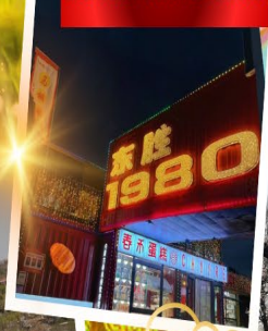
ถนนคนเดินคังบาหิซี