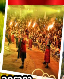
ปาร์ตี้รอบกองไฟ