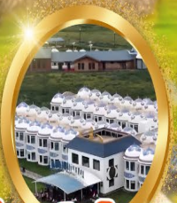
ที่พักสไตล์กรังโฌ