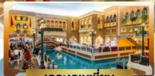
เดอะเวเนเซียน

4 วัน | 3 คืน | น้ำหนักกระเป๋า 23KG | พักโรงแรม 3 ดาว | นอนมาเก๊า 3 คืน