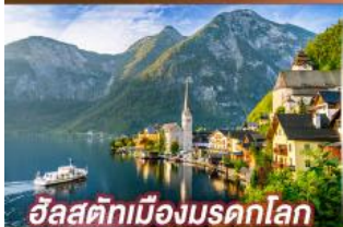
อัลสติกเมืองมรดกโลก