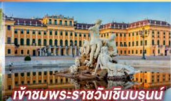
เข้าชมพระราชวังฮินบรุนน์