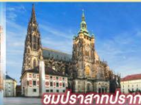
ชมปราสาทปราท