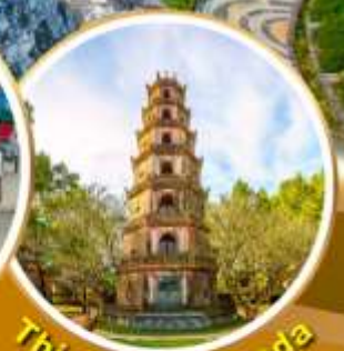
Thien Mu Pagoda