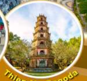
Thien Mu Pagoda