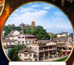
เมืองโบราณฉือจี้โข่ว