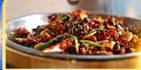
อาหารเสฉวน