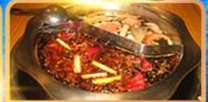
สุกี้ท้องถิ่น