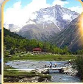
อุทยานปี้เฟิงโกว