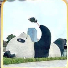
แพนด้าเซลฟี