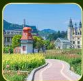
สวน Alice's Garden