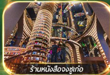
ร้านหนังสือจุงชู่เก้อ

เที่ยวชม 2 อุทยาน ปี้เฟิงโกว & จิวจ้ายโกว (รถเหมา)