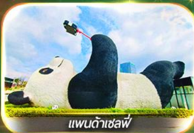
แพนด้าเซลฟ์