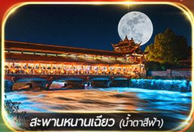
สะพานหนานเจียว (น้ำตาสีฟ้า)