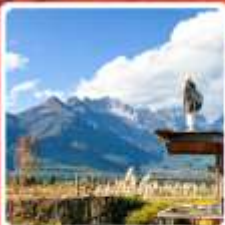
คาเฟ่ YUN DI AN