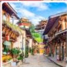
เมืองโบราณแชงกรีล่า

ไฮไลท์...บินตรงลงลี่เจียง นั่งกระเช้าชมภูเขาหิมะมังกรหยก เช็กอินคาเฟ่ยอดฮิต YUN DI LAN CAFE