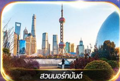
สวนนอร์คบันด์