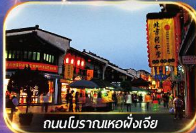
ถนนโบราณเหอผิงเจีย

เช็คอินมุมนิตใน TIKTOK ณ หาดไว่ทาน เตอะบันด์ + หอไข่มุก อิสระช้อปปิ้งย่านดัง หรือ เลือกซื้อ OPTION SHANGHAI DISNEYLAND