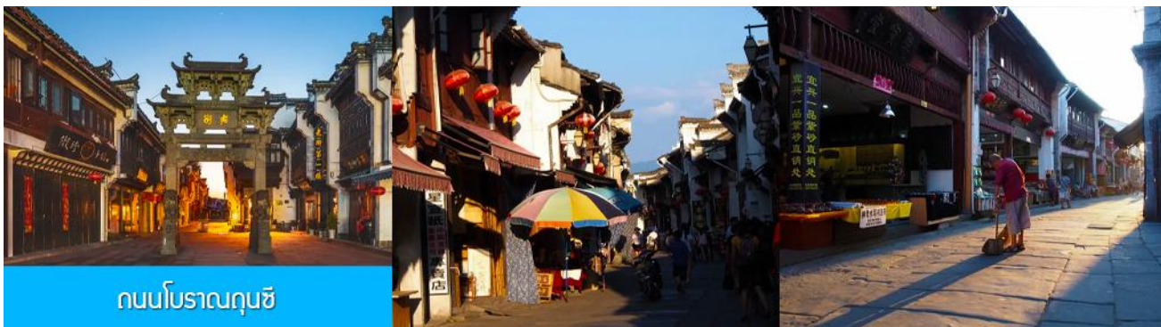
ถนนโบราณถุนซี

อิสระอาหารมื้อกลางวัน ( ท่านสามารถเลือกชิมอาหารพื้นเมืองในระแวกโรงแรมได้ตามอัธยาศัย )