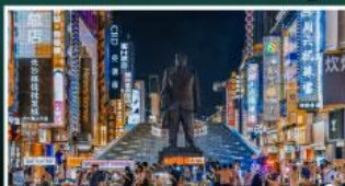
ถนนแดนเดินเขางิงคู่