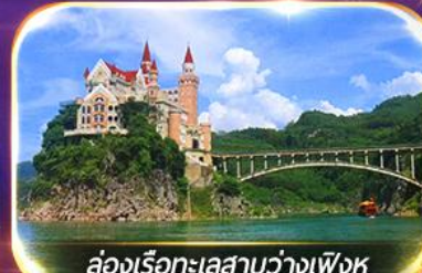
ล่องเรือทะเลสาบว่างเฟิงหู