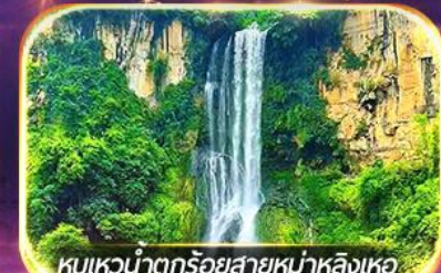
หุบเขาน้ำตกร้อยสายหม่าหลิงเหอ

ชมวิถีชีวิตหมู่บ้านปู้อี้ยามค่ำคืน, ล่องเรือทะเลสาบว่างเฟิงหู ชมสวนดอกไม้ตามฤดูกาล, ซอปปิงจูงใจถนนคนเดิน