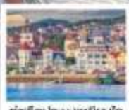
ท่าเรือประมงเหยียนโก๋