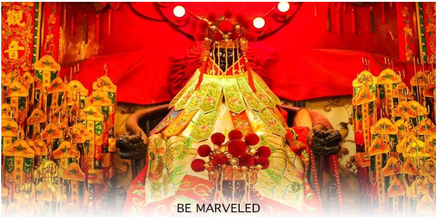
วัดเจ้าแม่กวนอิมสองอำ (ยิมฮิน)

จากนั้นนำท่านสู่ เจ้าแม่กวนอิม วัดสองอำ (HUNG HOM KWUN YUM TEMPLE) เป็นหนึ่งในวัดที่เก่าแก่ที่สุดของฮ่องกง และชาวฮ่องกงเลื่อมใสศรัทธามาก สร้างขึ้นในปี ค.ศ.1873 ในสมัยช่วงสงครามโลกครั้งที่ 2 มีการปล่อยระเบิดลงบริเวณใกล้กับวัดแห่งนี้หลายต่อหลายครั้ง ทำให้มีผู้บาดเจ็บและล้มตายมากมาย แต่ชาวบ้านที่หนีเข้าไปหลบภัยในวัดนี้ก็กลับปลอดภัยอย่างปาฏิหาริย์ และตัววัดก็ไม่ได้รับความเสียหายจากเหตุการณ์ทิ้งระเบิดที่น่าอัศจรรย์ ตามความเชื่อของคนจีนใน ฮ่องกง-มาเก๊า จะมี "วันเปิดทรัพย์" หรือ "พิธียืมเงิน เจ้าแม่กวนอิมฮ่องกง" เป็นวันที่จะมาขอพรและยืมเงินเจ้าแม่กวนอิม ซึ่งนับจากหลังวันตรุษจีน ไป 26 วัน จะเป็นวันเปิดทรัพย์ที่จัดขึ้นในทุกๆปี พิธีนี้จะมีเพียงครั้งปีละครั้งเท่านั้น เป็นวันสำคัญอีกวันที่คนหลังไหลมาไหว้ขอพรอย่างไม่ขาดสาย