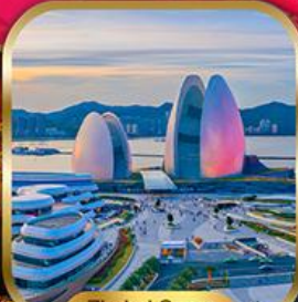
Zhuhai Opera House