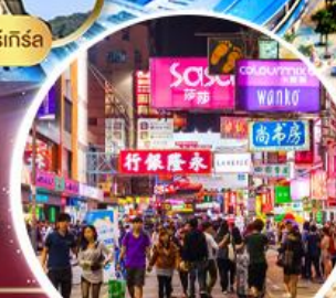
Shopping Tsim Sha Tsui