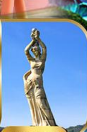
จูไห่ฟิชชอร์ทิวรา