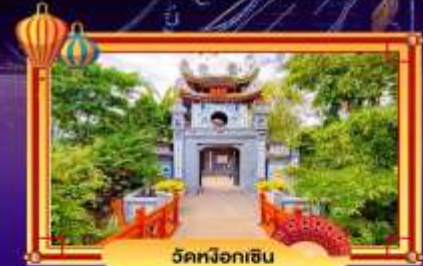
วัดนโงกฮิน