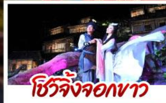
ชีวิตจริงจอกษา