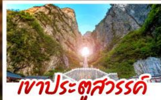
เขาประตูลสวรรค์