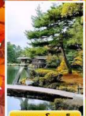
สวนเคนโระคุเอ็น

🍽️ ออนเซ็น 3 คัน 🧳 นน.กระเป๋า 23 กก. ☀️ 7Days 5Night