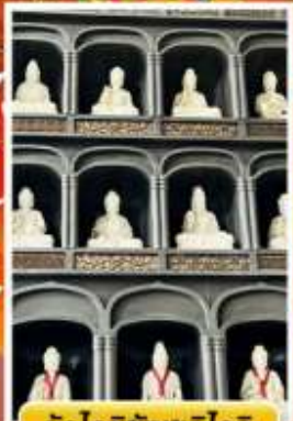
วัดไดชิซังเซอิโดจิ