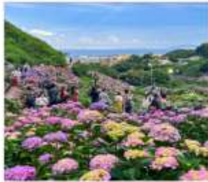
เทศกาลดอกไฮเดรนเยีย