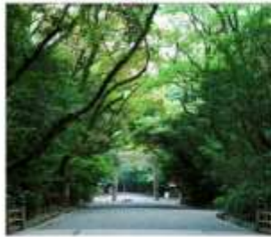
ศาลเจ้าอัสึตะ