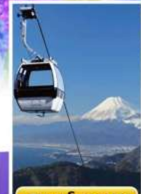
อิซุพานรามาวิว