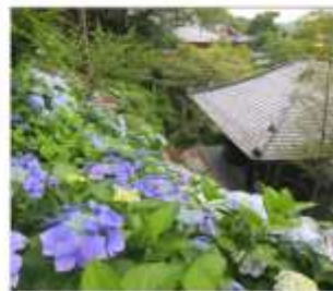
วัดฮาเซเดระ(เดรนเยีย)