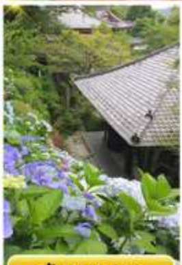
วัดฮาเซเดระ