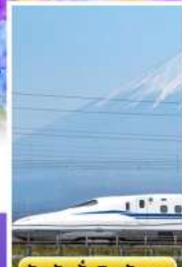
สัมผัสนั่งชินคันเซน