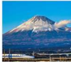
นั่งชินคันเซนชมฟูจิ