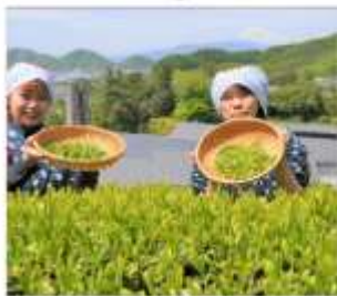
กิจกรรมเก็บชา