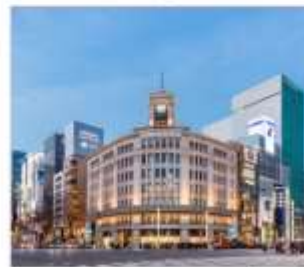
กินซ่า ช้อปปิ้ง