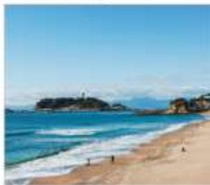
เกาะเอโนชิมะ