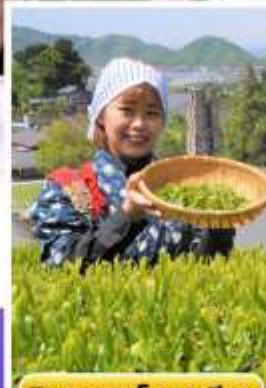
กิจกรรมเก็บชาเขียว