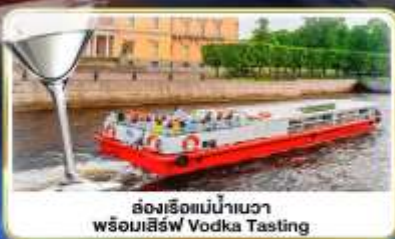
ล่องเรือแม่น้ำเนวา พร้อมเสิร์ฟ Vodka Tasting