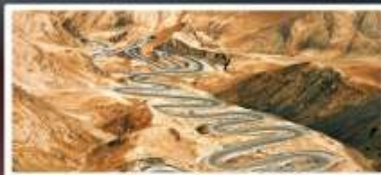
ถนนโบราณผืนหลงกู่เต้า