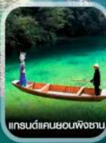
แกรนด์แคนยอนผิงซาน

✈️ คอนเฟิร์มออกเดินทาง ทุกพีเรียด 2 ท่านขึ้นไป ✈️