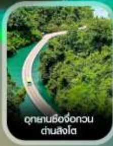
อุทยานซีจื่อถกวน ด่านสิงโต