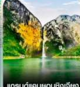
แกรนด์แคนยอนชิงเจียง