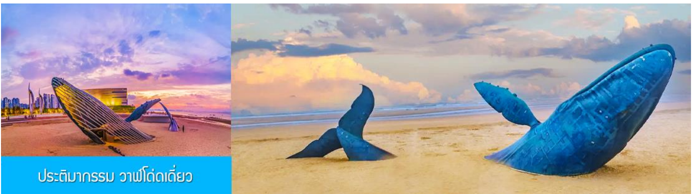
ประติมากรรม วาฬโดดเดี่ยว

นำท่านชมซุ้มประตูฝงไหล พระราชวังมังกร พระราชวังราชินีแห่งสวรรค์ และศาลาหลัก ชมทัศนียภาพอันตระการตาของเขตแดนทะเลเหลือง-ทะเลป้อไห่ ชม " ศาลาอมตะทะยานสู่ท้องฟ้า " จากนั้นนำท่านเดินทางไป ยังจุดชมวิวแปดเซียนข้ามทะเล ชมสถานที่สำคัญอันเป็นสัญลักษณ์ เช่น หอคอยเซียนหยวน กำแพงแปดเซียน และศาลาฮู่เซียน โครงสร้างรูปทรงน้ำเต้าที่ล้อมรอบด้วยทะเลทั้งสามด้าน เชื่อมโยงตำนานแปดเซียนเข้ากับ ความมหัศจรรย์ของภาพลวงตา