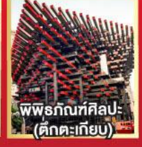
พิพิธภัณฑ์ศิลปะ (ตึกตะเกียบ)