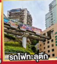
รถไฟฟ้า-ลู่ตึก