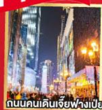
ถนนคนเดินเจียฟางเป่ย์