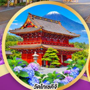
วัดโทเซคิจิ