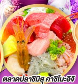
ตลาดปลาฮิมิสึ คาชิโนะอิชิ