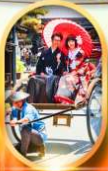
เมืองเก่าทาคายามา