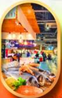
ตลาดปลาโงโง