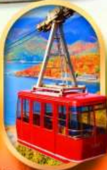
ขึ้นกระเช้าทะเลสาบมิกะตะ