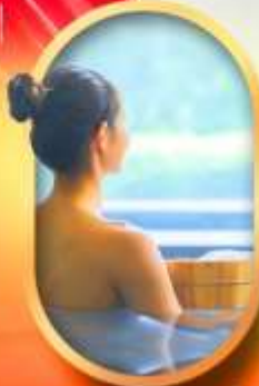
พักรอแรมออนเซ็น