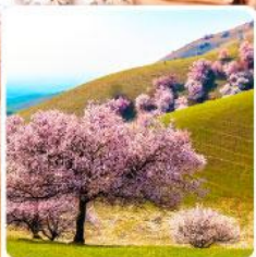
ทุ่งดอกอัลมอนต์