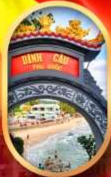
ศาลเจ้าดิงเกา