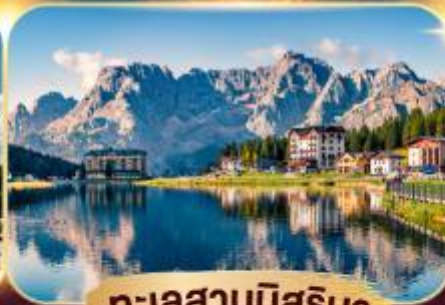
ทะเลสาบมิสุรีนา