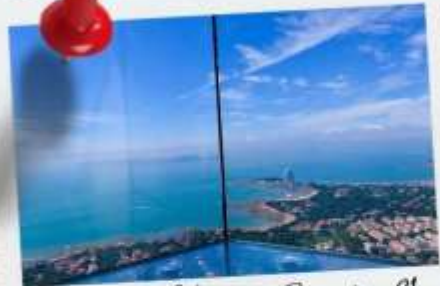
Qingdao Haitian Center ชั้น 81