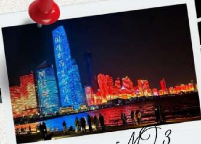
หาดไซเบอร์ MO.3