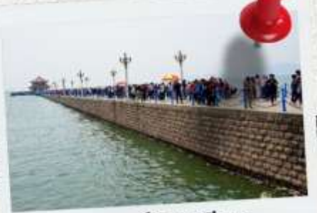
สะพานฉ่านเจียว