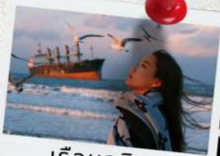
เรือบลูวิส