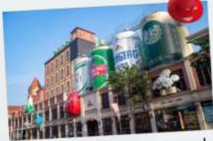
พิพิธภัณฑ์เบียร์ชิงเต่า