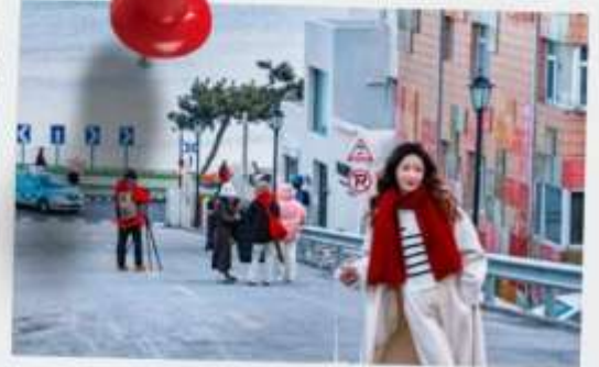
ถนนฮั่วจวีปา