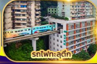
รถไฟทะลุตึก