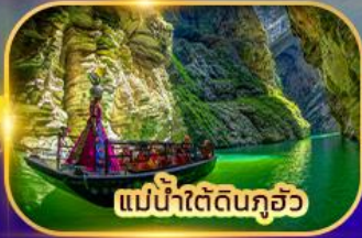
แม่น้ำใต้ดินกุ้ยโจว