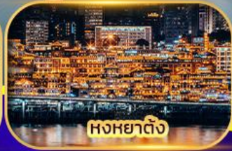
หงหยาดิง