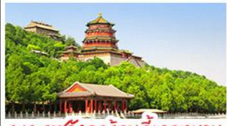
พระราชวังฤดูร้อนอี๋เหอหยวน

กำแพงเมืองจีนด่านจวิรงกวน - พระราชวังฤดูร้อนอี๋เหอหยวน สวนจิ่งอัน - วัดลามะ - ไหม่หลงร้านช้อปปิ้ง - โรงแรม 4 ดาว บ๊อพิซซ เปิดปักกิ่ง สุกี่มองโก MICHELIN GUIDE ร้าน TAO TAO JU