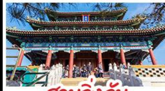
สวนจิ่งอัน