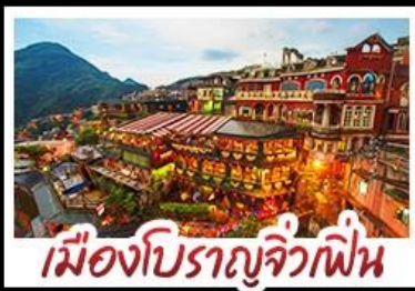
เมืองโบราณจีวเฟิน

เที่ยวธรรมชาติระดับโลก เอเชีย ทะเลสาบสุริยันจันทรา - เมืองดงครม ไทเป จีวเฟิน - ซีเหมินติง