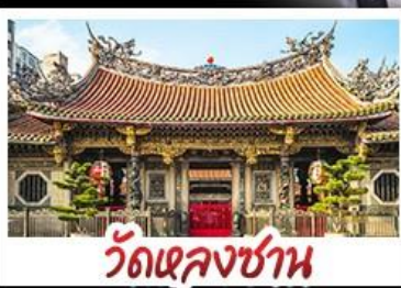
วัดเล่งชาน