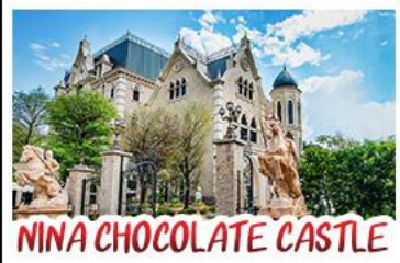
NINA CHOCOLATE CASTLE

ทะเลสาบสุริยจันทร - ไทเป 101 จิวเฟิน - NINA CHOCOLATE CASTLE MONSTER VILLAGE - ซีเหมินติง เมนูพิเศษ ปลาประจานาธิบดี เขี้ยวหลงเปา / ชาบูใต้หวัน