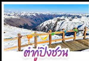
ต้ากู่ปิงชวน