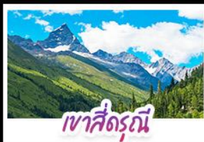
เขาสี่ดรุณี