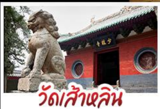
วัดส้าหลิน