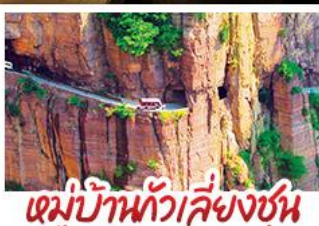
หมู่บ้านทิวสียงซุน