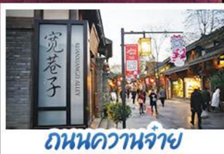
ถนนชุนซีลู่