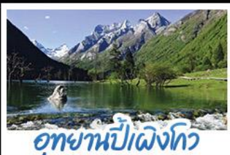
อุยกานปี้เฉิงโกว

ภูเขาสীদেরณี อุกยานจิวจ้ายโกว นั่งรถไฟความเร็วสูง น้ำพุไม้ไฟตึกSKP อุยกานปี้เฉิงโกว วัดต้าฉือ ถนนโบราณชอยกวางชอยแดบ ช้อปปิ้งถนนไถ่กู่หลี่ + ถนนชุนซีลู่