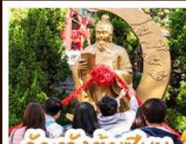
วัดเซ่งต้าซิงหน