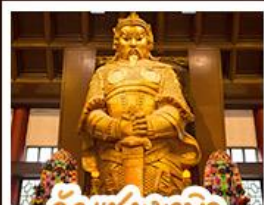
วัดเชกงไฉมว