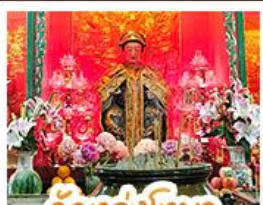
วัดเส่งงไฉมว

นั่งรถรางพีคแตรมสู่ TOP OF PEAK • ช้อปปิ้งจุใจมงก๊ก และ CITYGATE OUTLAETS • นั่งกระเช้าองปิง สักการะพระใหญ่เทียนถาน • จอพรเจ้าแม่หล่งโหมว แมงอง 5 มังกร ให้ประสบความสำเร็จในทุกๆ ด้าน