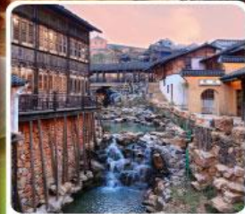
เมืองโบราณเหยาหู