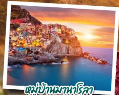
หมู่บ้านมาหาริคา