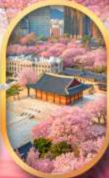
พระราชวังชางด็อกกุง