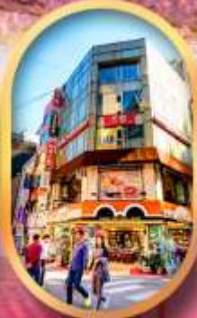
ช้อปปิ้งย่านเมืองคัง