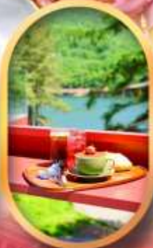
คาเฟ่ลับกลางป่า