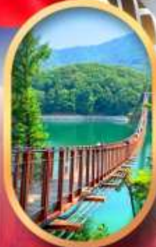
สะพานแขวนมาจิง