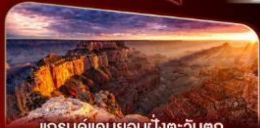
แกรนด์แคนยอนฝั่งตะวันตก