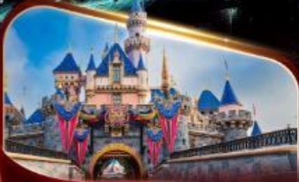
ดิสนีย์แลนด์ปาร์ค