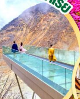
OWAKUDANI EARTH VALLEY