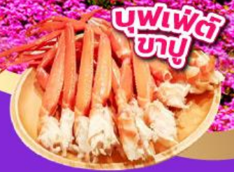
บุฟเฟ่ต์ ขาปู