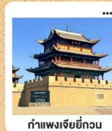
กำแพงเจียยี่กวน