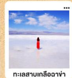
ทะเลสาบเกลือฉาซ่า