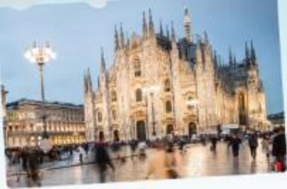
คูโอโม มิลาน