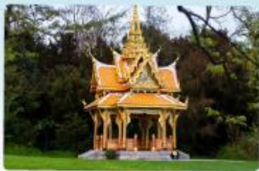
ศาลาไทย โสขานันท์