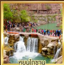
หยุ่นโกซาน