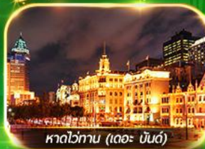
หาดไข่มุก (เดอะ บันด์)

เที่ยวมหานครเซี่ยงไฮ้ ถ่ายรูปเช็คอินที่ Tian An 1000 Trees, ซินเทียนตี้ ช้อปปิ้งตลาดเงินหวงเหมียว, ถนนนานกิง