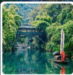
หมู่บ้านชาบเสี่ยเหมินเจีย