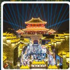
เมืองโบราณเซียงหยาง