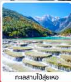
ทะเลสาบโป้สุ่ยเหอ